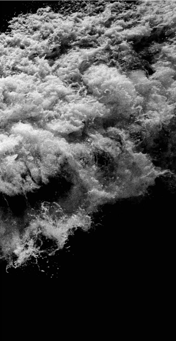
Bugwelle, 1989/2002 C-Print/ Diasec/ Objektrahmen 40 x 60 cm (Rahmen 85 x 100 cm) Auflage 6 Ex. + 2 EA