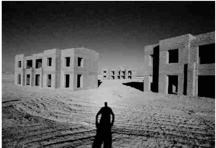
Selbst 2001-III (Sinai-III), 2001 C-Print/ Passepartout/ Holzrahmen 9 x 14 cm (Rahmen 32 x 32 cm) Auflage 25 Ex. + 5 EA

trifft in den Arbeiten von Peter Schlör mit dem Rätsel des Sehens zusammen. Sein eigentliches Motiv: Das gleiche ist nicht dasselbe, obwohl das Bild sich in seinem Gegenstand zunächst den Anschein gibt."