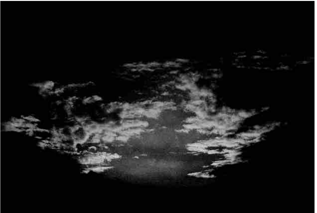
Himmel, 2002 2-teilige Arbeit, C-Prints/ zwei Objektrahmen je 19 x 29 cm (Rahmen je 55 x 55 cm) Auflage 6 Ex. + 1 EA